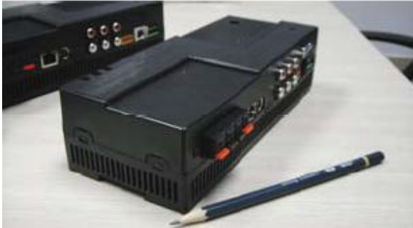
תמונה 1-בקר מוזיקה

בקר המוזיקה הינו התקן המתחבר לרשת האס-באס ומאפשר שליטה על מוזיקה דרך התקני הבית החכם וכן שילוב מוזיקה בתרחישים השונים.