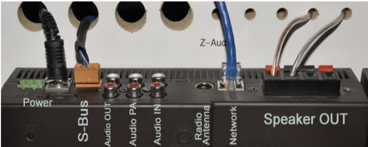
תמונה 2-חיבורי בקר המוזיקה