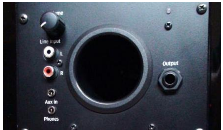
תמונה 4-חיבור למערכת שמע חיצונית